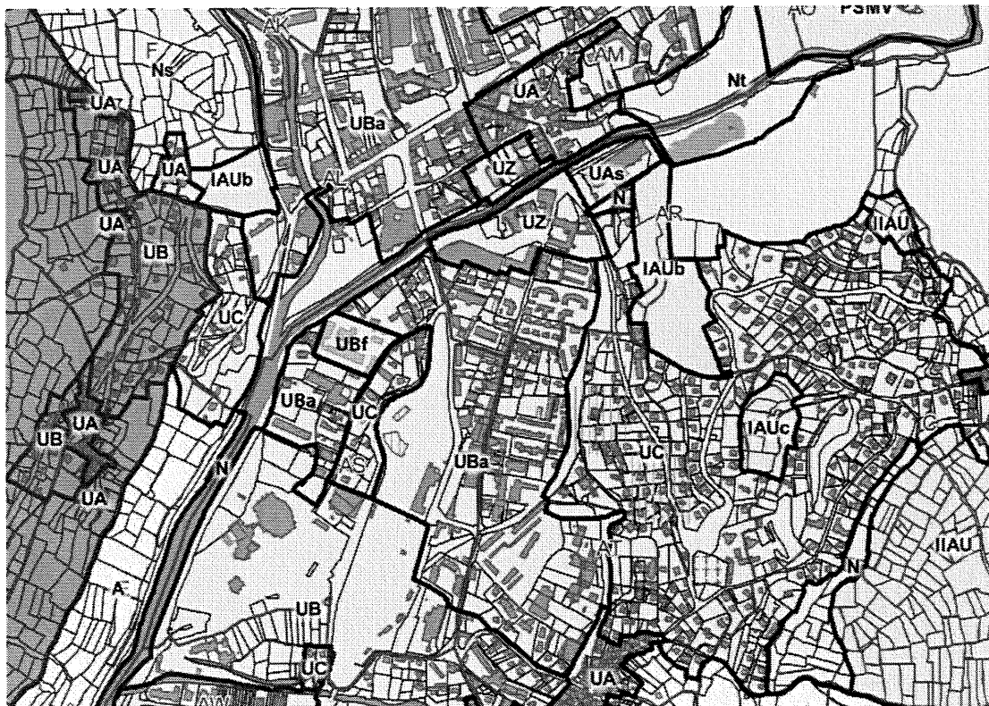
Graphique du PLU (après la modification simplifiée n°9)