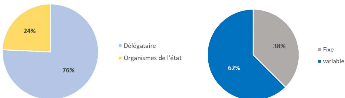
Répartition de la facture TTC